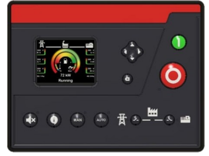
Resim 1: AMF-L Ön görünüm